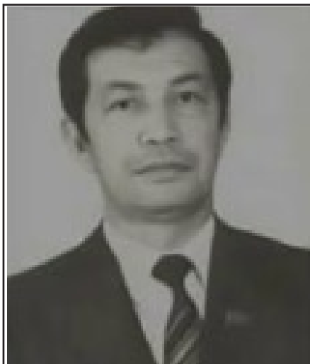
“Бу бир парча қоғоз!” - И.Каримов ўз ўринбосари Ш. Мирсаидовни минбарга чиқариб, унинг воситасида Декларацияни танқид қилди.

қилмади. Декларация муҳокамаси пайтида Каримов ўз ўринбосари Шукрулло Мирсаидовни минбарга чиқариб, унинг воситасида Декларацияни танқид қилди. Мирсаидов Декларация матнини ҳавода силкитиб, “бу бир парча қоғоз” дея залга мурожаат қилганда, миллатвакиллари қаттиқ реакция кўрсатишди. Вазиятнинг тахмин қилинганидан мураккаброқ эканини тушунган ҳукумат Декларацияни овозга қўйишга мажбур бўлди ва лекин унинг қабул қилинишини ҳукумат ҳам кутмаганди.