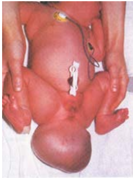
Female infant with a large sacrococcygeal teratoma that developed from remnants of the primitive streak. The tumor, a neoplasm made up of several different types of tissue, was surgically removed. About 75% of infants with these tumors are female; the reason for this preponderance is unknown.

У тажрибаларини амфибиялардан (сувда ҳам, қуруқликда ҳам яшай оладиган жонзотлар) бошлади. Тажрибаларининг бирида у бир ҳомилани “бирламчи асоси”ни айна шу “ёш”даги (яъни, учинчи ёки тўртинчи ҳафталик биринчи ҳомила давридаги) бошқа ҳомиланинг эпипластикга кўчириб ўтказди. Бу тажриба кўчириб ўтказилган “бирламчи асос”дан иккинчи эмбрионнинг пайдо бўлишига олиб келди. Кўчирилган аъзо “янги муҳит” атрофидаги ҳужайраларга таъсир кўрсатди. Натижада биринчи ҳомила танасида иккинчи ҳомила ҳосил бўлди.