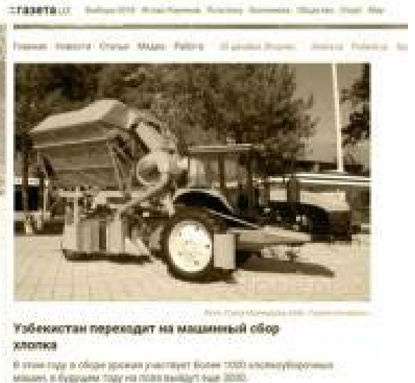
Ўзбекистон переаждет на машинный сбор хлопка