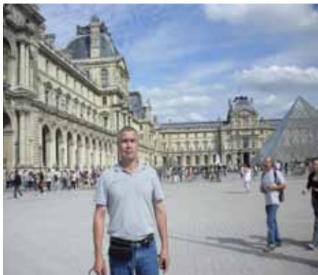
(Ёки Ҳаракатимиз стратегияси ҳақида)

Ўтган йили бир қатор араб мамлакатларида бўлиб ўтган инқилоблар кўпчиликлда Ўзбекистонда ҳам шундай жараёнлар бошланишига умид уйғотди.