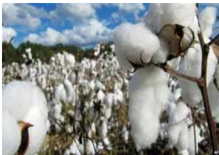
Малик Мансур, “Америка Овози”

Ўзбекистон пахта теримига ҳозирланмоқда. Маълумотларга кўра, ҳукумат бу йили ҳашарчилар ва талабалар иштирокини яна-да кенгайтиради. Айти пайтда марказдан вилоятларга йўлланган комиссия пахта далаларида улар учун яратилаётган шарт-шароит билан танишмоқда. Ўқувчилар бу мавсумда ҳам асосий иш кучи бўлиши кутилмоқда. Лекин Бош вазир Шавкат Мирзиёев халқ таълими бўлимига болалар меҳнатини таъқиқлаш ҳақида буйруқ бериб, бу қонунга зид эканини эслатган. Вазиятни кузатиб турган фаоллар назарида бу шунчаки кўзбўямачилик.