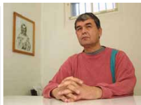
МУҲАММАД СОЛИҲ ИЛА...