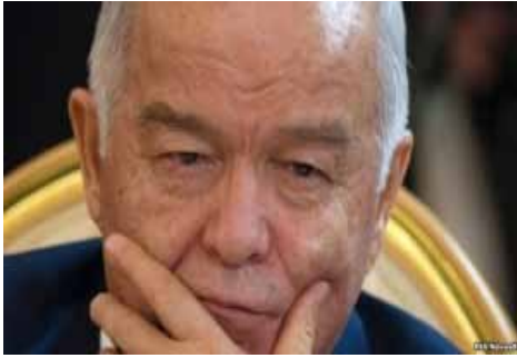
(Давлати: Боши олдинги саҳифада)

Бу шаклда инсонларимизга Ҳақ тарафидан берилган истеъдод, қобилият ва тадбиркорлик йўқка чиқди. Натижа эса нафақат мамлакатдаги иқтисодий бўҳрон, балки шахс ва жамиятнинг маънавий-ахлоқий тубанлашуви шаклида бугун очикча ўртададир.